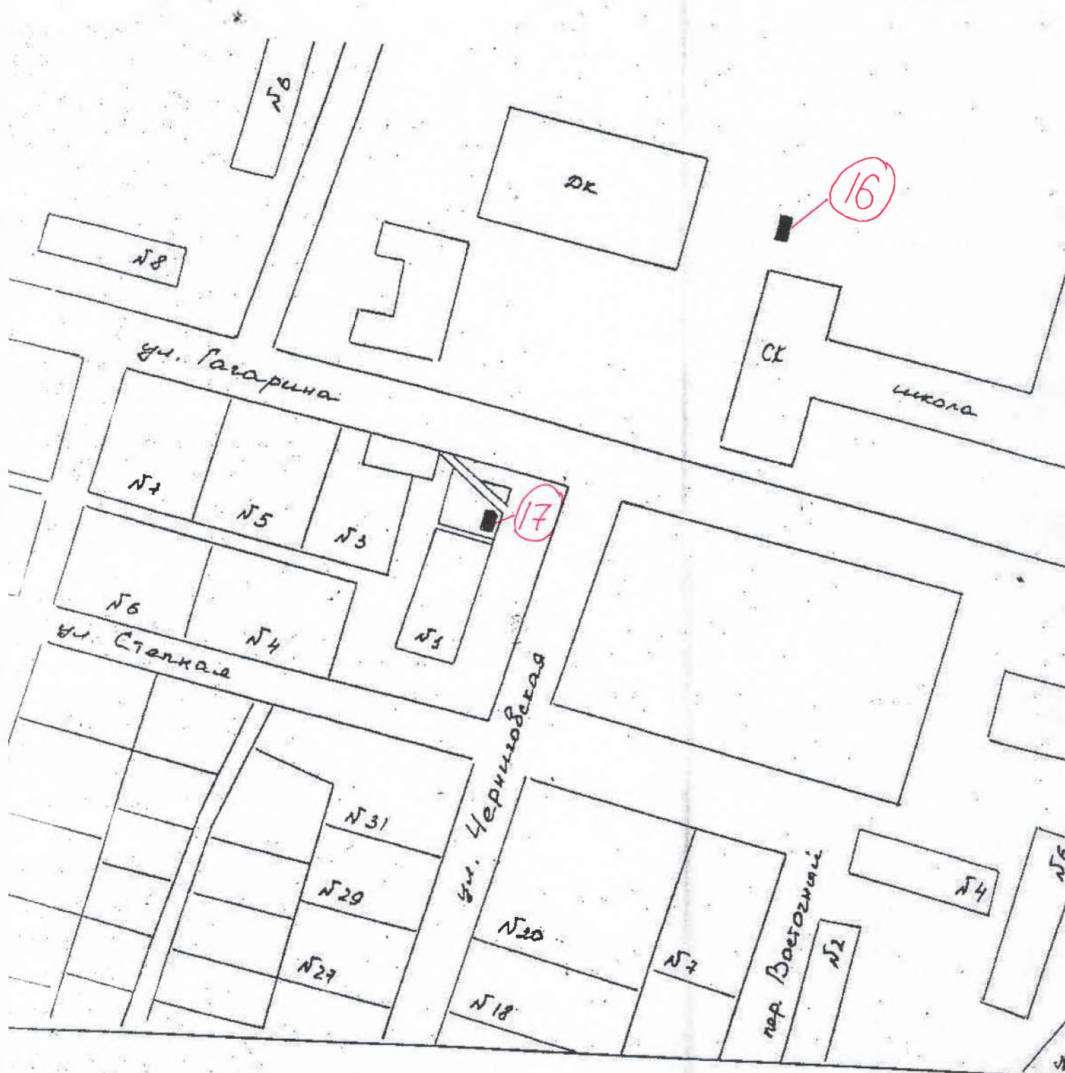
Схема дислокации временных объектов торговли и предоставления услуг в с.Фрунзе Администрация Фрунзенского сельского поселения Сакского Района Республики Крым